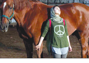
ورایتی به بهانه‌ی نمایش فیلم درسا در جشنواره فیلم «برلین» در نوشتاری درباره‌ی این فیلم ایرانی نوشت.

در این یادداشت آمده است: «درام جوانانه‌ی درسا؛ که یک داستانی اخلاقی برای عصری جدید است، پیامدهای رشد شکاف اجتماعی در جامعه معاصر ایران را با قدرت ترسیم می کند و طبقات متوسط و فرادستی را محکوم می کند که هسته اخلاقی خود را از دست داده‌اند.