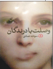
وصلت با درندگان امیرسون

این نخستین رمان عمادی است که پیش از این بیشتر در عرصه هنرهای نقاشی و خطاطی فعالیت داشته. هر چند او از پنج سال پیش مشغول داستان نویسی است. این کتاب با نشر دات در ۳۰۴ صفحه با تیراژ ۶۵۰ نسخه و با قیمت ۲۲ هزار تومان منتشر کرده است.